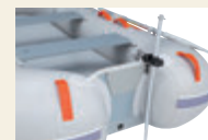
魚探センサーをセット