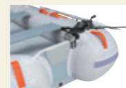
サオ受けをセット