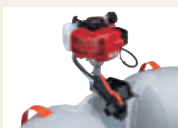
エンジンをセット

マジックマグとワンダーマグには32cm幅のランサム付き。 エンジンとランチングホイールが装着できます(取り付け穴あり)。