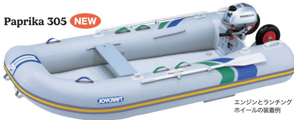
エンジンとランチング ホイールの装着例