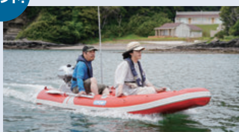
カヤック340SPに2馬力船外機を搭載した走り