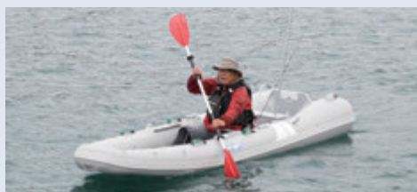
カヤックとしてパドルングも楽しめます。また、SUPとして立って漕ぐこともできます。可能性は無限です