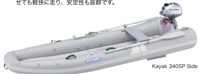
Kayak 340SP Side

細身なのに、しっかりとしたキールの入ったV型ボトムは、2馬力エンジンで走航すると、スピードを前提に設計されたJ-キャットに遜色のない高速性を誇ります。船尾のチューブ径が太く浮力が大きいので、重いエンジンを載せても軽快に走り、安定性も抜群です。