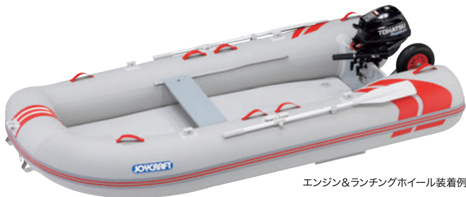
エンジン&ランチングホイール装着例