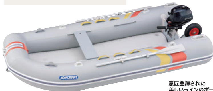
意匠登録された 美しいラインのボート群

しなやかなので畳みやすく コンパクトに！ A4カタログと比較してみ て下さい（JSL-260）