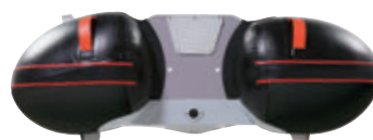
MUG-205のような小型モデルには ビッグスターンで大浮力をプラス