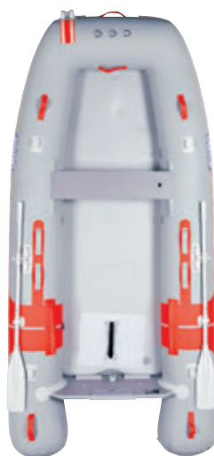
スターンの浮力を高めつつ、 広い船内を誇るオレンジベコ

さらにジョイクラフトの生み出すデザインはワンパターンではありません。多彩な船型を次々と世に送り出しています。そのどれもが小型ボートといえど独創的かつ合理性のあるデザイン。ほとんどの船型が意匠登録されていることが他の真似ではない証でしょう。“世界中で他にない優れたオリジナルであること”がジョイクラフトのデザインポリシーです。