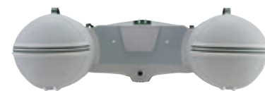
高さ10cmのトンネルで水の抵抗を抑 えるJ-キャットの船型

合理的なフォルムとバランスだから使いやすく、しかも美しい。ジョイクラフトのクラフトマンシップは、ボート設計から小さな部品に至るまで、手を抜かない一貫したものです。多彩でありながら、統一感ある美しさ。他の追随を許しません。