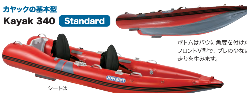
Kayak 340 Bottom