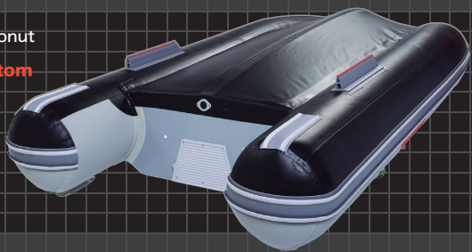
Coconut 303 Bottom