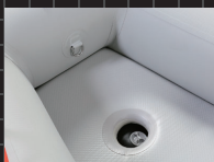
エアフロア& エアキール