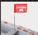
フラッグ 装着用装備