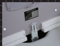
船内セルフ ブローラー