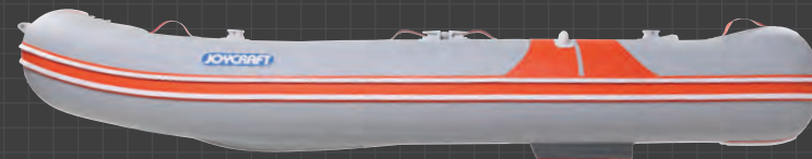
Orange Pekoe 323W Side