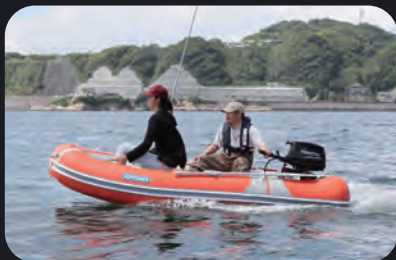
6馬力船外機まで搭載可能なオレンジペコ305ワイドの軽快な走航シーン。

「ボートはもっと安全に快適に、面白く楽しめる乗り物であるべき」。ジョイクラフトがインフレーターボートの世界基準に位置づけるのが、このカテゴリー。堅実な走り、乗り手の視線を重視し、使い勝手を追求したオリジナルデザインは、ボータイングの魅力を最大限に引き出します。皆様の期待を超える実力を是非フィールドで実感してください。