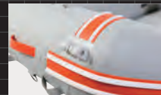
アンカーローラー & ロープリーダー