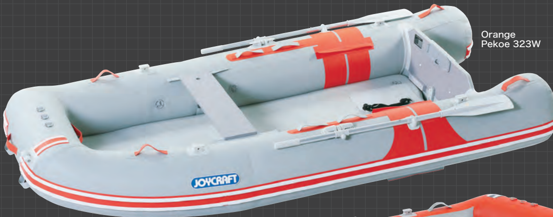
Orange Pekoe 323W