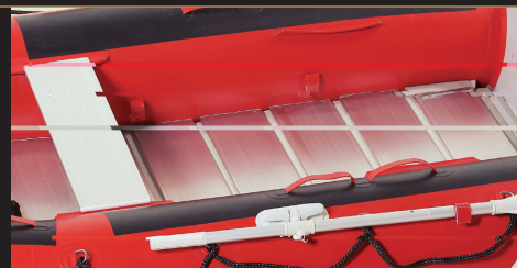
アルミロールアップフロアをエアフロアに重ねた様子

オプションのハイブリッドアルミロールアップフロアをセットにしました。20cm幅のアルミボードを連ねたフロアと、高圧エアフロアを重ねることで、アルミの剛性と高圧エアフロアのショックレスを両立させました。また、ボートはロールアップしてコンパクトに収納できます。JEH-400、385 / それぞれ約20kg、JEH-315 / 約14kg。