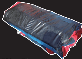
アルミフロアをセットしたままでもコンパクトに折りたたむことが可能です。