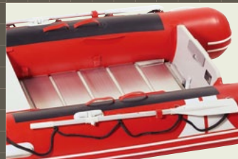
剛性とショックレス性を両立させた素晴らしいフロアです。

JEHシリーズのJEH-385/315には、アルミロールアップフロアをオプションで用意しています( JEH-385 / 22kg、JEH-315 / 18kg)。20cm幅のアルミボードを連ねたフロアを、本体の高圧エアフロアの上に重ねて装着することで、アルミの硬さおよび剛性と、高圧エアフロアのショックレス性を両立するフロアとなります。また、不使用時にはアルミフロアはロールアップしてコンパクトに保管できます。高圧エアフロアと併用してご使用ください。