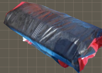
艇体にセットしたままでもコンパクトに折りたたむことが可能です。