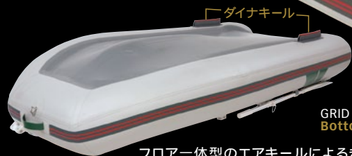
GRID 295 Bottom

フロー一体型のエアキールによるきつちりしたV方船型、左右のダイナキールとの相乗効果でブレない走りを実現。