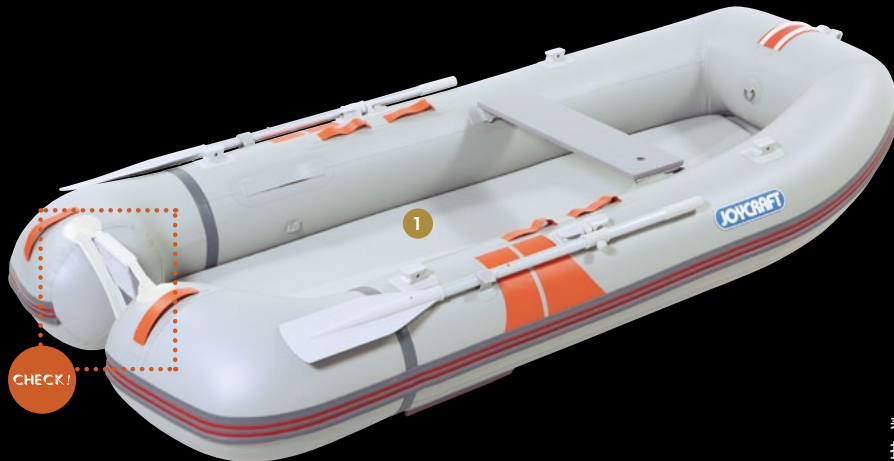
WONDER MUG 282

親しみやすいボートにミニマムサイズのトランサムを付け、機走する。そんな発想でできたのがWONDER MUG。小さくてもモーターマウント艇より本格的な走りを楽しめます。ローボートのな手軽さもあり、活用法はあなた次第。