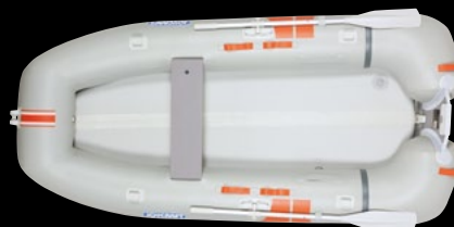
WONDER MUG 282

3~4人乗り リジッドフレックス 船体価格 163,000円 電動ポンプ付き 188,000円